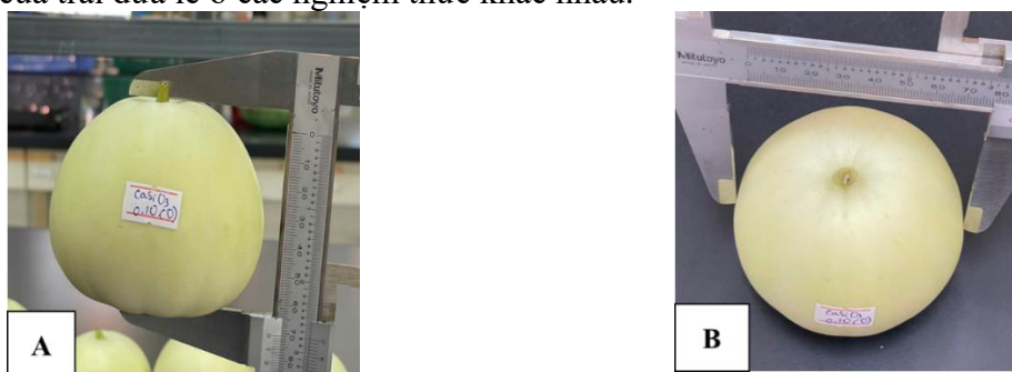
Hình 1. Đo đường kính trái và chiều cao trái của dưa lê

- Khối lượng trung bình (g/trái), khối lượng tổng/dây (kg/dây), khối lượng trái thương phẩm/dây (kg/dây), độ dày thịt trái (mm), kích thước trái: Hình 1 minh họa phép đo đường kính và chiều cao của trái dưa lê ở các nghiệm thức khác nhau.